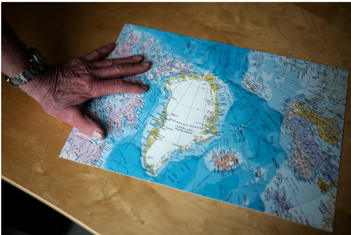
Grönland-Karte von Mikkelsen

»Kein Dorf«, sagt er und tippt auf eine leere Fläche. »Keine Straße.« Er tippt noch einmal. »Keine Menschen.« Im Osten Daneborg, im Westen Qaanaaq. Dazwischen: nichts. Manchmal fragte er sich auf Patrouille, was sie machen würden, wenn ein russisches U-Boot auftauchen würde. »Wahrscheinlich hätten wir Hallo gesagt und Kaffee getrunken«, sagt er. Sein Job sei es gewesen, zu beobachten. Aber es habe nichts zu beobachten gegeben.