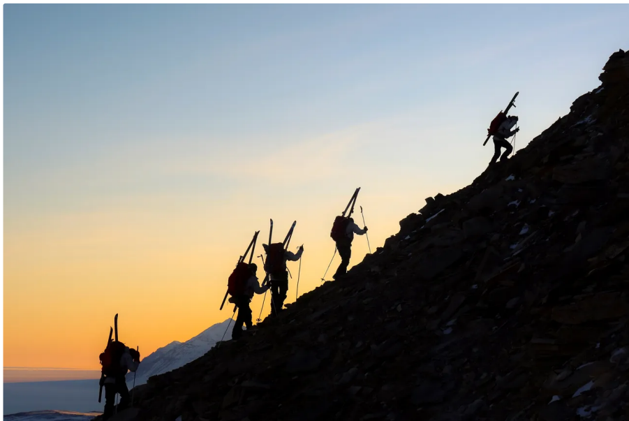
Sirius-Rekruten am Berg (2020): Hierarchien sind lächerlich

In Nordostgrönland kam es zu Begegnungen, bei denen ein Däne und ein Deutscher getötet wurden. Das war der erste und letzte Tote der Sirius-Patrouille, der in einem Gefecht starb. Souveränität, sagt Ibsen, ist manchmal nur eine Frage der Präsenz. Wenn du ein Land besitzen willst, musst du da sein. Auch wenn es absurd wirkt, durch eine Leere zu patrouillieren, in der scheinbar nichts geschieht. Dieses Nichts ist der Punkt. Wenn du nicht da bist, kann jemand anderes behaupten, es sei nie deins gewesen.