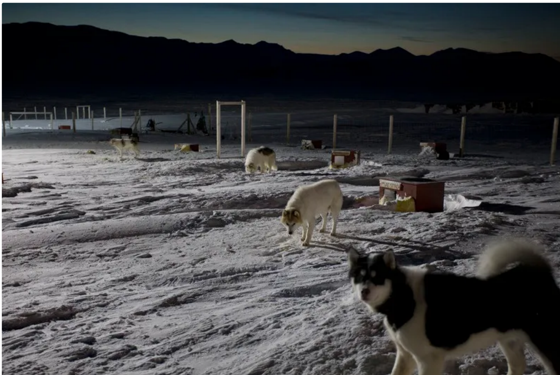
Hundezwinger der Sirius-Patrouille in Daneborg: Er vermisse die Hunde

Sein Roman heißt »Sirius«, erschienen im November 2025, es ist ein Bestseller geworden. Das Buch handelt von fremden Mächten in Grönland, erdacht, bevor Trumps Pläne so bedrohlich wirkten. Alles, was er schreibt, müsse möglich sein, sagt er. Möglich heißt nicht wahrscheinlich. Möglich heißt, dass es morgen passieren könnte. Ibsen sagt, das Szenario der Eroberung Grönlands sei schon immer realistisch gewesen. In Grönland ging es immer um Geld und um Wissen.