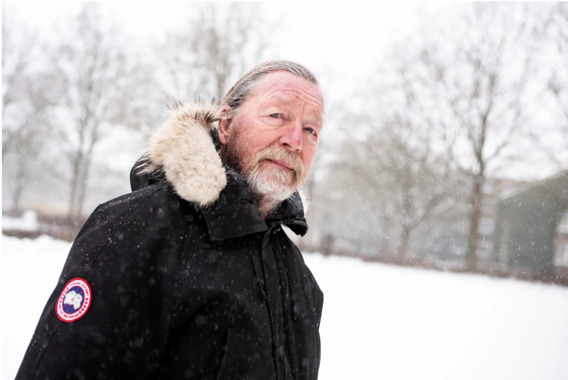
Berater Schmidt Mikkelsen: Wichtig, die Sonne aufgehen zu sehen