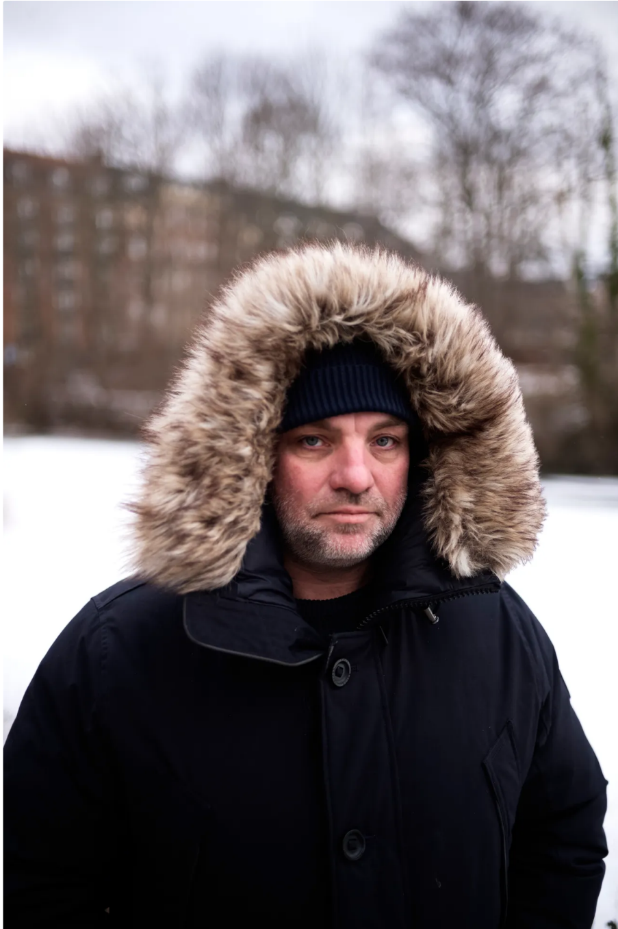
Autor Ibsen