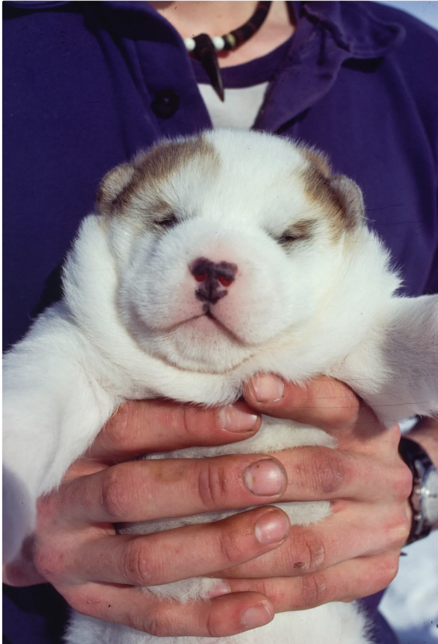
Hundewelpen auf Foto von Peter Schmidt Mikkelsen von 1978: Die Hunde sind Familie

Gefährte, Sensor, Warnsystem. Hunde können dünnes Eis spüren und ihm ausweichen, wenn sie nicht abgelenkt werden. Hunde warnen, wenn ein Eisbär kommt. »Und im äußersten Notfall kannst du sie essen«, sagt Fredslund, ohne Zynismus, eher wie jemand, der weiß, dass Überleben nicht schön sein muss.