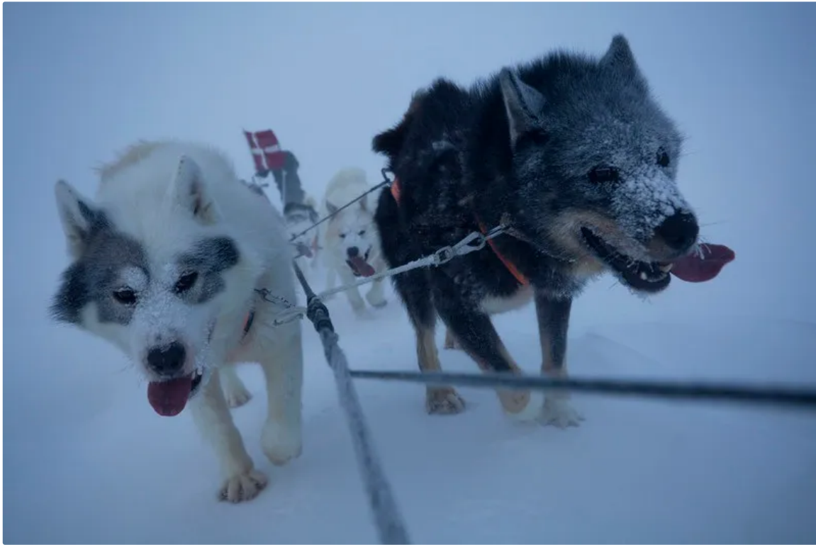
Schlittenhunde Batman und Yuri 2010: Laufen mehr als 20.000 Kilometer

Die Arktis ist umkämpft, ein militärischer Konflikt ist nicht mehr ausgeschlossen. Die Briten verdoppeln ihre Truppen am Polarkreis und schicken einen Flugzeugträgerverband in die Region, in Pituffik im Nordwesten Grönlands überwachen die USA den Himmel und den Weltraum. Russland hat in den vergangenen Jahren mehr als 50 sowjetische Militärbasen in der Arktis wieder in Betrieb genommen. Grönland ist der geostrategische Schlüssel zwischen Nordamerika und Europa . Wer hier Radarstationen, Unterwassersensoren und Häfen kontrolliert, gewinnt Frühwarnzeit für militärische Operationen und Einfluss auf die Nadelöhre des Nordatlantiks. Zugleich verlaufen in der Region sensible Datenkabel und Versorgungsrouten. Mit dem schwindenden Eis entstehen um die Insel neue Schifffahrtswege, an Land werden die Rohstoffe zugänglicher, seltene Erden , Uran , Gold . Jahrelang hat sich niemand für die Sirius-Patrouille interessiert, nun sind die Soldaten gefragte Interviewpartner.