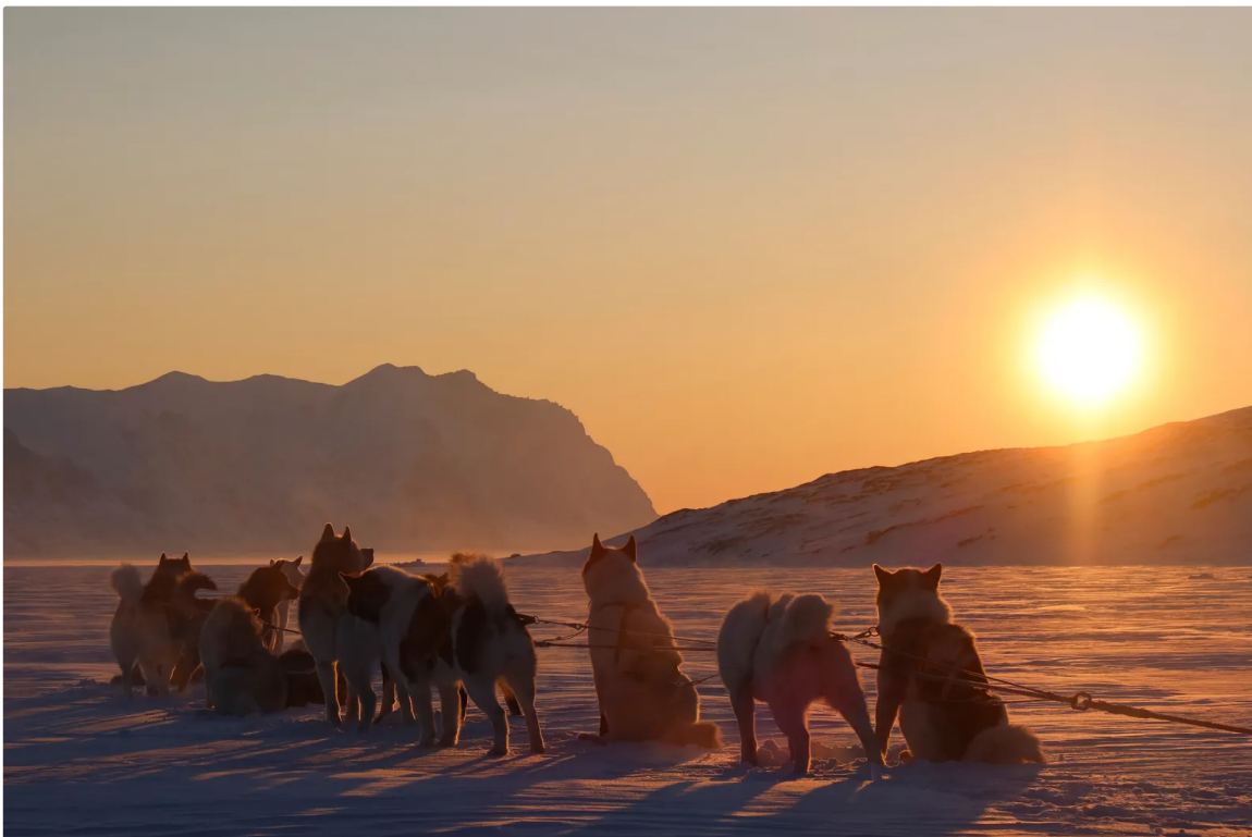
Hunde im Schnee bei Sonnenaufgang nach Polarnacht (2020): Netflix auf dem Eis, das Ende der Erfahrung.